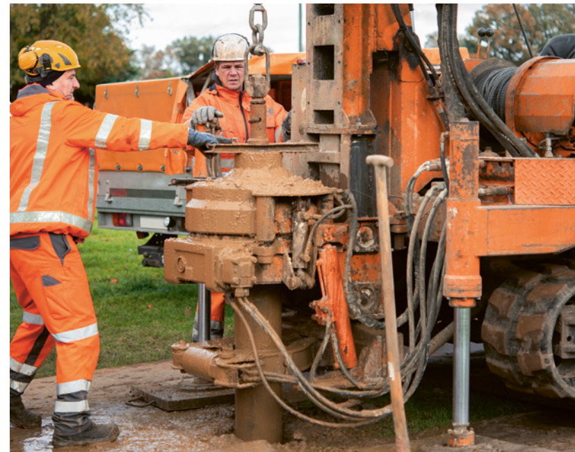
Oben: Dokumentation der Bodenfolge aus dem Hohlgestänge einer Kleinrammbohrung Unten links: Spitze einer Sonde für die Rammsondierung Rechts: Rammkernbohrung zur Erkundung der Schichtenfolge des Bodens