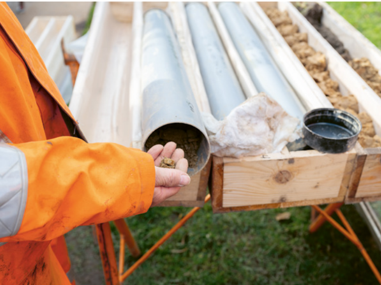
Bodenproben werden für das Labor in Transportkästen verpackt