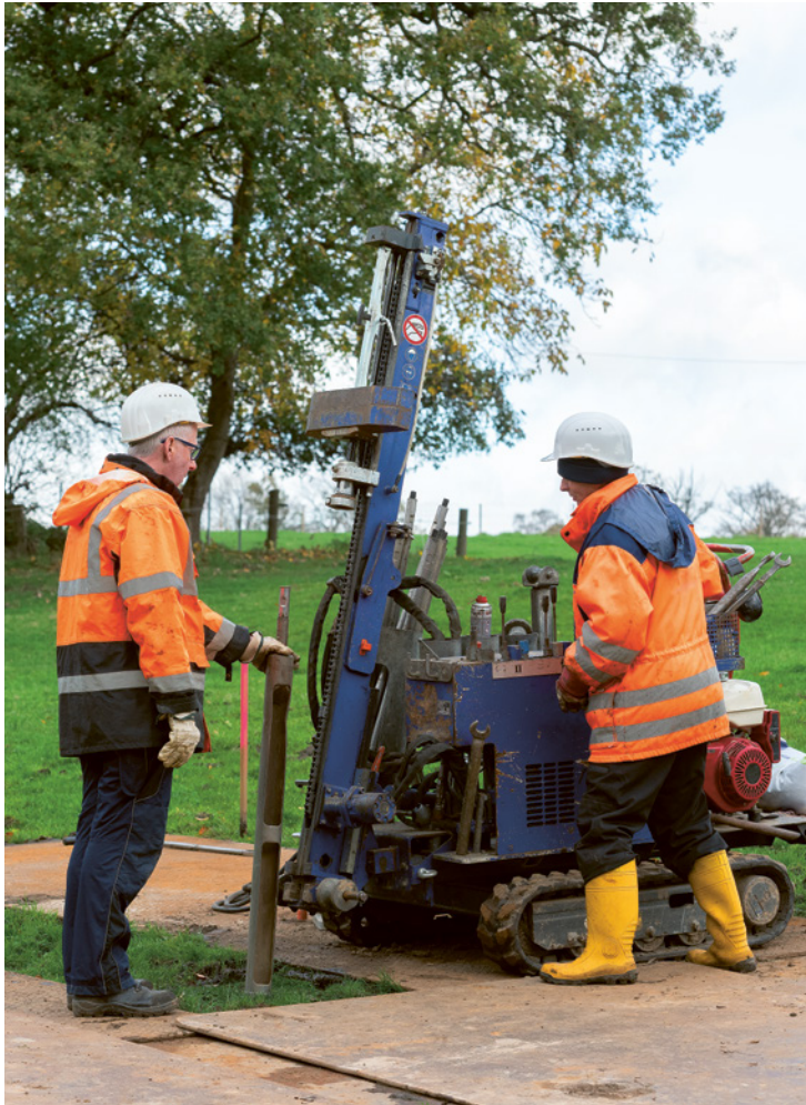
Bei der Kleinrammbohrung kommt ein Hohlgestänge zum Einsatz – das Ziel: Bodenproben entnehmen